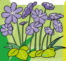
Печеночница благородная (первоцвет)

Первоцвет - низкорослое травянистое растение семейства первоцветных с красивыми цветками разнообразной окраски.