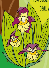
Орхидея венерин башмачок

Очень красивое растение - орхидея венерин башмачок. Похожая на голландский башмачок, она является символом заповедной зоны